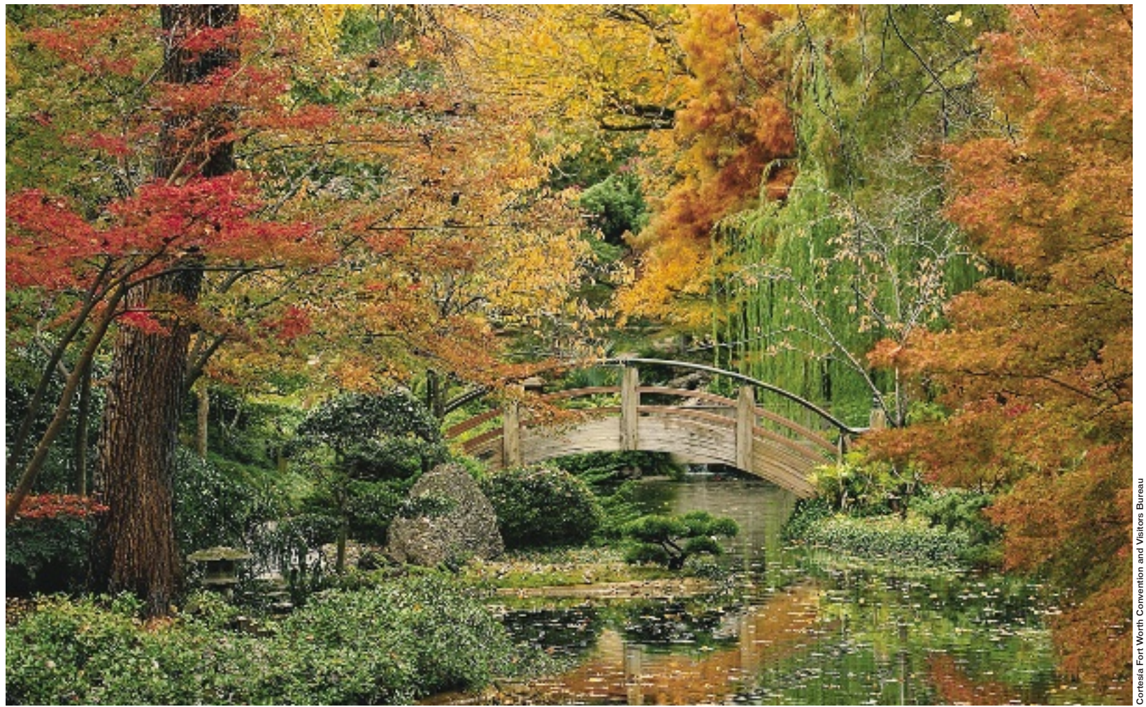
TEXAS. Caminos, puentes, esculturas de diseño europeo. Sublimes olores y colores en este antiguo jardín de Fort Worth.