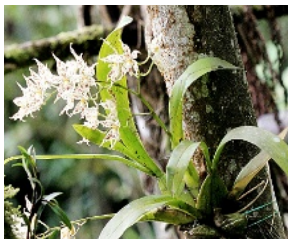
COLOMBIA. Juego de luz y sombras en este paraíso de orquídeas.